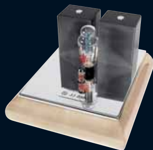
239 Farbvariante hell